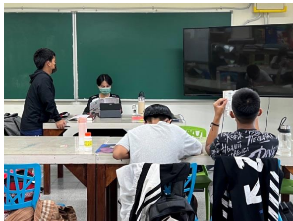
說明：高年級課業加強輔導