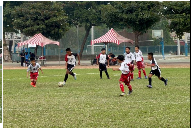
說明: 世界盃足球比賽過程中