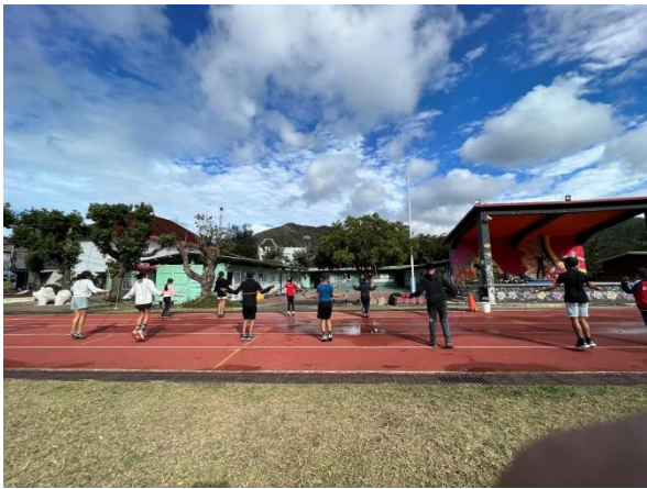
說明：體能訓練 跳繩