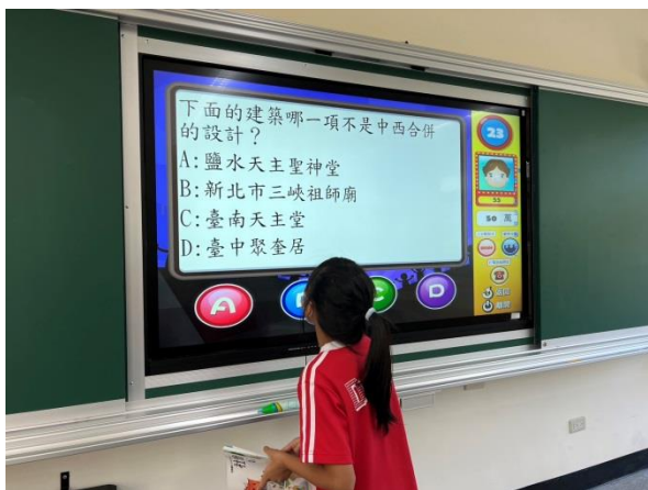
說明：中年級學科數位加強學習