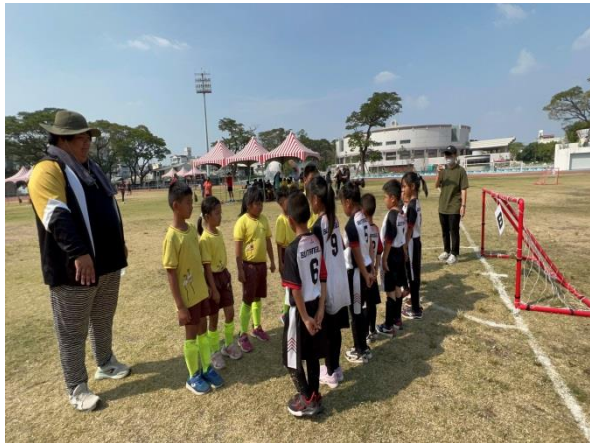
說明：110 年度樂樂足球比賽 低年級