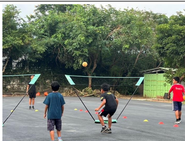
說明：籐球接合足球訓練方式