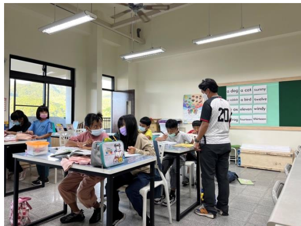
說明：中年級課業加強輔導