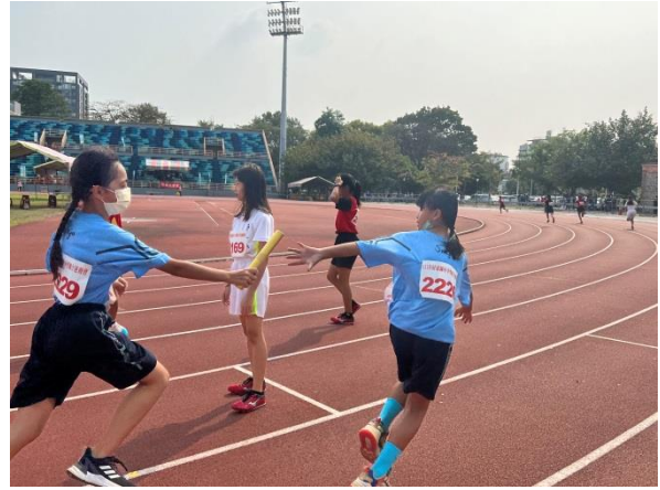
說明：111 年縣運比賽 國小女生 400 公尺接力比賽