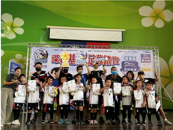
說明:111年迷你足球比賽 二年級 第三名