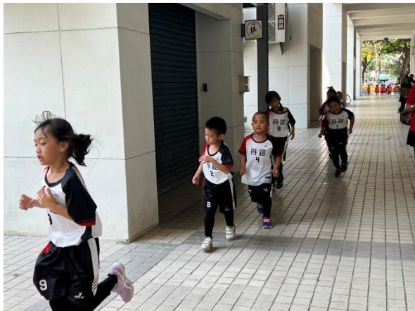
說明：110 年度樂樂足球比賽 練習前熱身做操