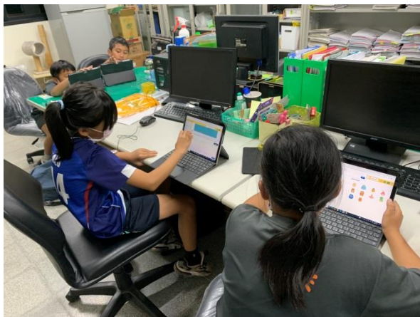
說明：中年級科目因材網學習