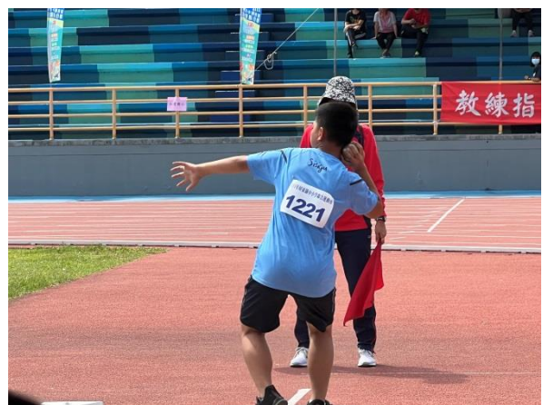
說明：111 年縣運比賽 國小男生鉛球比賽