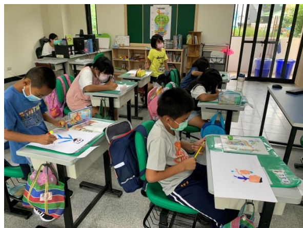
說明：中年級學科加強學習