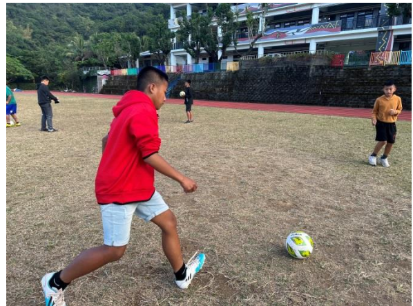
說明：足球基本技術訓練