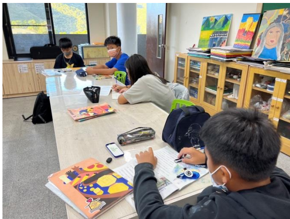
說明：高年級課業加強輔導