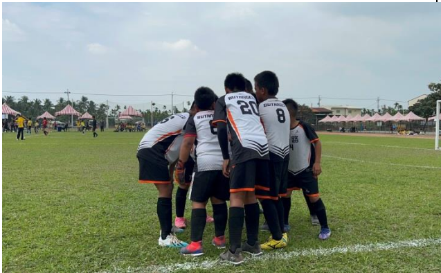
說明:世界盃足球比賽彼此鼓勵