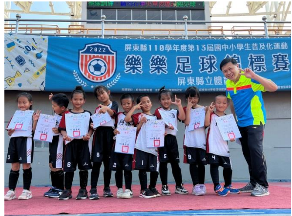
說明：110 年度樂樂足球比賽 低年級獲得第五名