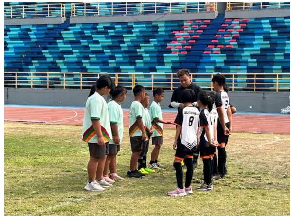
說明:110年度樂樂足球比賽 中年級