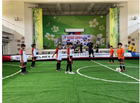
說明:111年迷你足球比賽 比賽過程中