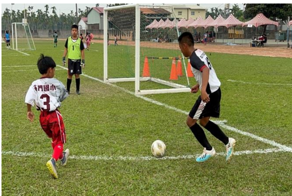
說明: 世界盃足球比賽攔截敵人球