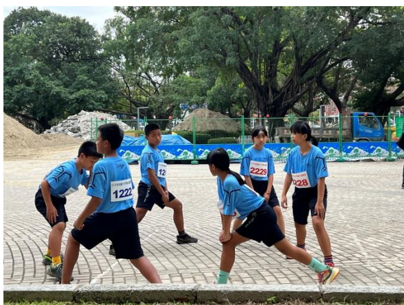
說明：111 年縣運比賽熱身