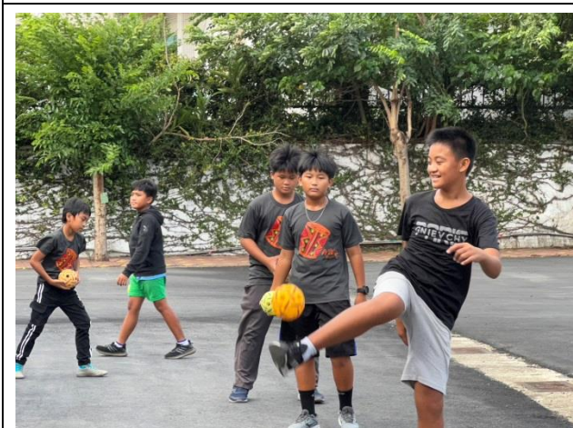
說明：籐球接合足球訓練方式